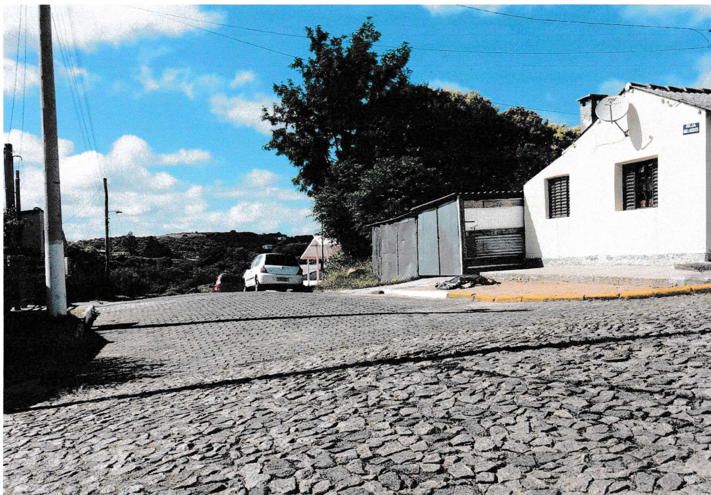
Rua Manuel de Macedo Neto, esquina com a Rua Borges de Medeiros