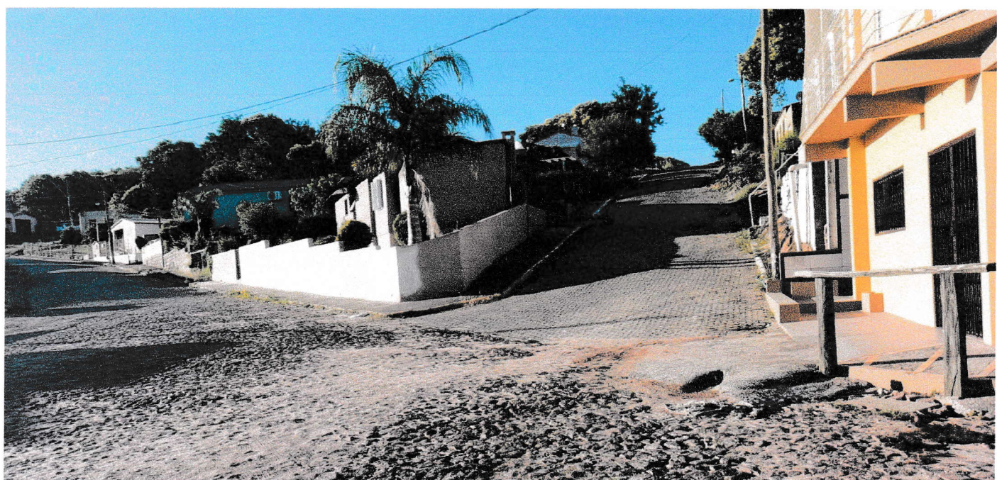
Rua Manuel de Macedo Neto, esquina com a Avenida Coronel Galvão